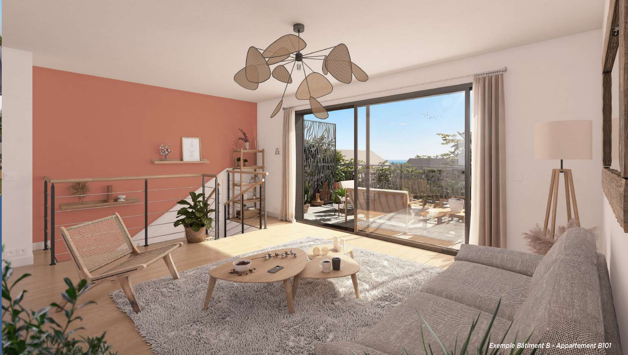
Exemple Bâtiment B - Appartement B101