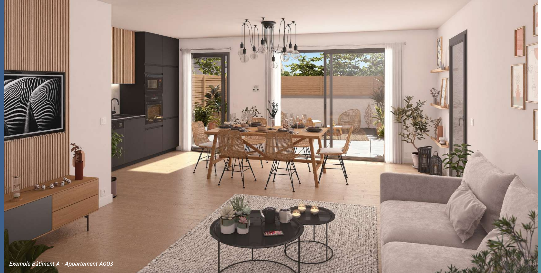
Exemple Bâtiment A - Appartement A003